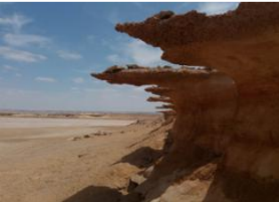
Sahara Marocain 📍 Khaoui Nam 📍