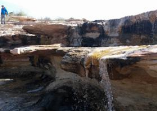
Jebel Rich 📍 Sahara Marocain 📍