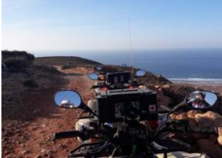
Tnine Aglou 📍