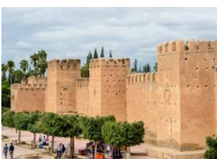
Tnine Aglou 📍